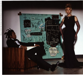
About Love TIFFANY & CO.