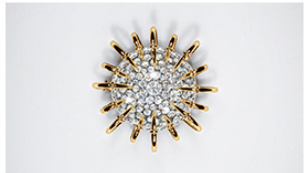
About Love TIFFANY & CO. FILM ANSEHEN