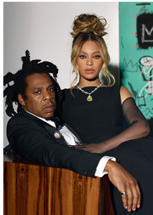
About Love TIFFANY & CO.