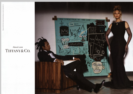
About Love TIFFANY & CO.